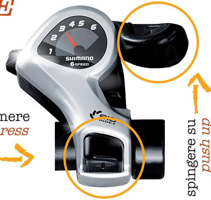
cambio manuale manual transmission