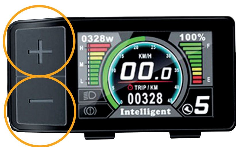
ciclocomputer cycle computer